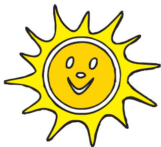
Základní škola a Mateřská škola Holoubkov