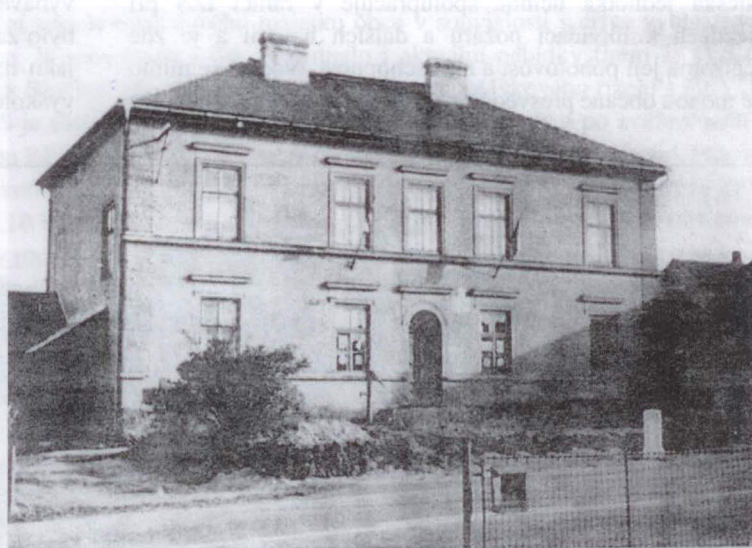
Budova nové školy č.p. 14