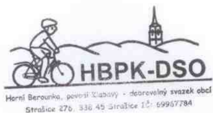
ing. Lukáš Fišer předseda DSO HBPK

Připomínky k závěrečnému účtu DSO mohou občané uplatnit písemně ve lhůtě do 10.6.2019 do 14,00 hod. na adresu Obecní úřad Dobřív, Dobřív 305, 338 44 Dobřív nebo ústně na sněmu, kde bude závěrečný účet projednáván.